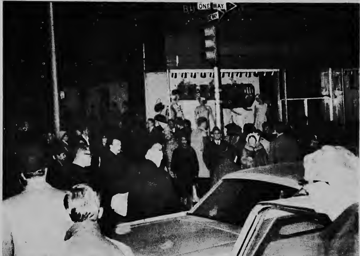
NEW YORK -- Riba e foto aki nos por mira algun viajero ta cana riba 8th Avenue durante e "Black Out" cu tabatin ayera nochi na New York y cu a dura mas o menos 12 ora. Awe mainta mas o menos cinc'or corriente a bini bek.

E gobernador di e estado di New York, Nelson Rockefeller, a keda aisla pa un tempu den un avion cu tabata bula bai bini riba e ciudad. Despues e por a baha ne aeropuerto di e guardia, pa keda inmoviliza pa trafico y finalmente, ora cu el a logra yega su oficina despues di subi diescincu pisa di trappi--el a ordena pa e Guardia Nacional colabora den proteccion di e personanan y den esfuerzonan pa crea vianan pa transito.